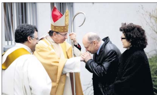
Kardinal Kurt Koch wird bei der italienischsprachigen Mission seiner Heimatgemeinde Emmenbrücke empfangen.

Koch: Die Okumene muss stetig gepflegt werden. Dies geht nur über persönliche Beziehungen und Besuche vor Ort. Für mich bedeutet dies, dass ich ziemlich viel in die Luft gehe. Nicht aus Ärger, sondern wegen der grossen Distanzen.