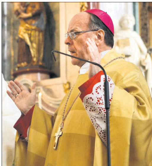
Versteht die Angst um die Einheit der Kirche: Bischof Huonder.

Huonder wertet durch die Gründung dieser zwei Pfarreien die Traditionalisten auf. Personalpfarreien sind etwas Seltenes. Im Bistum Chur gab es beispielsweise bis anhin lediglich zwei: Die beiden Zürcher Italienermissionen sind Personalpfarreien. Die Zugehörigkeit zu Personalpfarreien ist nicht vom Wohnsitz, sondern von den Bedürfnissen oder der Nationalität der Gläubigen abhängig.