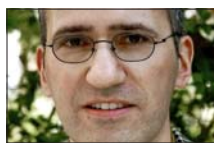
«Die Schweiz hätte dank dem Parlament einen offiziellen Ansprechpartner.»

wurde von den beiden wichtigsten muslimischen Nationalverbänden – Koordination Islamischer Organisationen der Schweiz (KIOS) und Föderation Islamischer Dachorganisationen der Schweiz (FIDS) – in Auftrag gegeben. Laut Loretan geht es darum, aufzuzeigen, «wie sich die neuen Religionen in der Schweiz