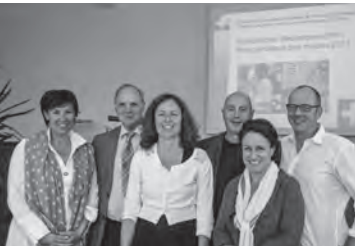
Prix catholique des médias

Au mois d'avril 2011 , le site Catholink a cédé la place à Cath.ch, qui a pour mission d'être la référence incontournable de l'Eglise catholique en Suisse romande. Il doit marquer le paysage médiatique romand. L'Agence de presse internationale catholique apic à Fribourg, est le moteur du site qui l'alimente par un flux continu de nouvelles sept jours sur sept, 365 jours par an. Le site offre une information journalistique, mais aussi des documents originaux, des chroniques et des commentaires. Après un début un peu chaotique, le site a pris au cours de l'année 2011 sa vitesse de croisière, des ajustements étant constamment apportés au module.