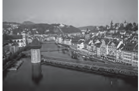
Stadt Luzern, Kulisse der GV 2011

Der SKPV-Präsident plädierte ebenfalls dafür, dass religiöse Informationen vermehrt auch von der nichtkirchlichen Presse aufgenommen werden, wie dies der «Businessplan» der