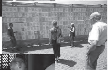
Einsiedeln 2003 Cinich-Wallfahrt