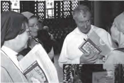
Tagesatzung der Ordensleute Freiburg 2003