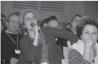
Débat lors des Journées d'Études François de Sales

L'Association catholique mondiale pour la communication SIGNIS organise son Congrès Mondial 2014 à la fin du mois de février, à Rome. La nouvelle génération et les nouveaux médias constituent le thème central de la rencontre.