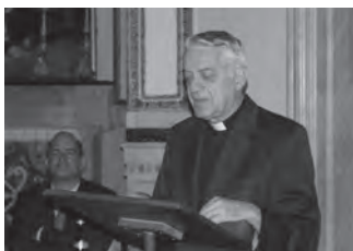
Pater Federico Lombardi SJ, Direktor des Vatikanischen Presseamtes, Festredner am CIC-Jubiläum