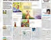
Wie war denn das mit Ostern?

1) Ob Kreuzigung Jesu oder Pfingstereignis: Es ist nicht immer einfach, Kindern die biblischen Geschichten näherzubringen. Vielen Kinderbüchern gelingt dies aber ganz gut. Wir stellen einige Neuerscheinungen vor.