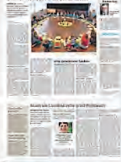
Essen wie Jesus in Jerusalem