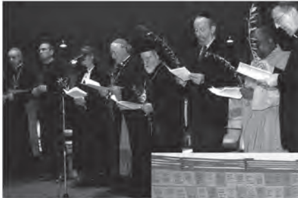
Interreligiöse Begegnung Gemf 2003

Bien qu'en 2013 la RKZ veuille elle-même compléter sa propre communication jugée trop scripturale et in-