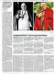
Grosse Ehre für Jahrhundert-Päpste