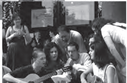
Flyer 2003