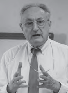
Mgr Albert Rouet

nication), lors du Festival international de San Sebastian en Espagne.