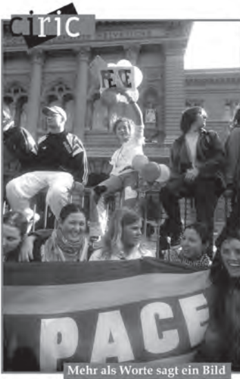
Mehr als Worte sagt ein Bild

métier la Suisse et le monde au service de l'agence.